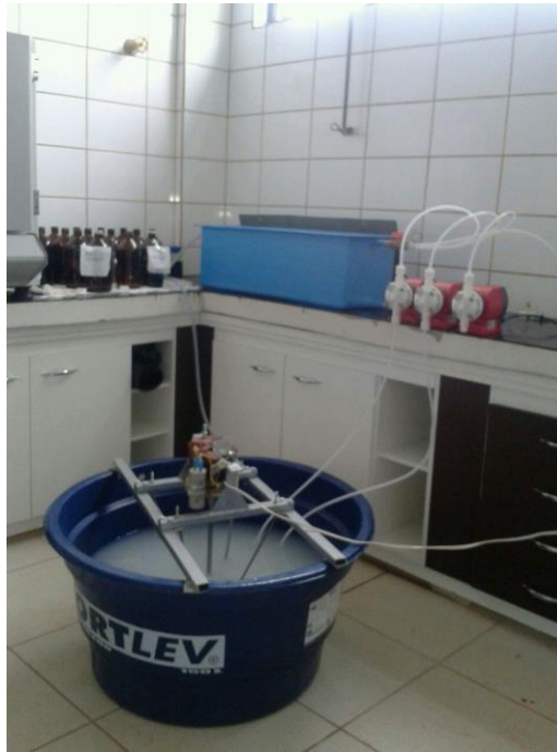
FIGURA 2. Sistema de tratamento proposto pelo trabalho. Caixa de gordura conectada à caixa d'água de alimentação através de bombas reguladoras de vazão.

Para avaliar a eficiência das caixas de gordura, foram analisadas nas amostras de entrada e saída, as variáveis: Demanda Química de Oxigênio (DQO) e a quantidade de Óleos e Graxas (O&G). Assim como o experimento, as análises de todos os testes foram realizadas no laboratório de Águas Residuárias do Núcleo de Engenharia Ambiental e Sanitária da UFLA, seguindo os procedimentos de APHA et al. (2012).