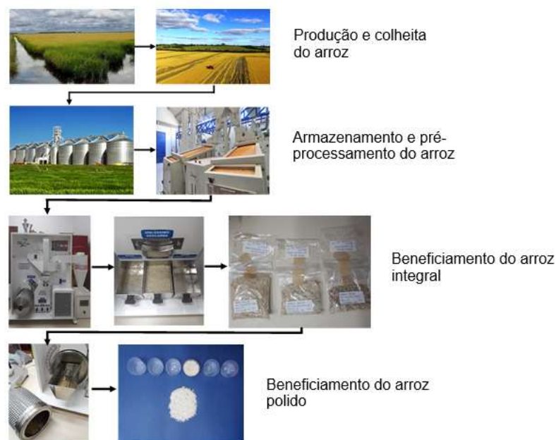
FIGURA 1. Produção, colheita, pós-colheita e beneficiamento do arroz.

MATERIAL E MÉTODOS: o trabalho de pesquisa foi desenvolvido no Laboratório de Pós-Colheita (LAPOS) da Universidade Federal Santa Maria (UFSM), Campus de Cachoeira do Sul (CS) e no Instituto Riograndense do Arroz (IRGA) (Figura 1).