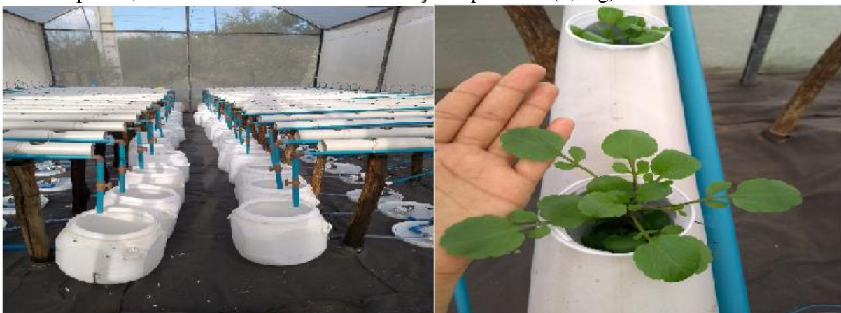
FIGURA 1. Área experimental (A) e agrião cultivado no sistema NFT (B)

MATERIAL E MÉTODOS: O experimento foi conduzido na estação agrometeorológica do Departamento de Engenharia Agrícola (DENA), na Universidade Federal do Ceará, Campus do Pici , Fortaleza – CE, em casa de vegetação no período de dezembro de 2018 a janeiro de 2019. O sistema hidropônico adotado foi o NFT (técnica de fluxo laminar de nutrientes). A estrutura foi composta por 40 perfis hidropônicos (Figura 1A) de tubos de PVC com 2,70 m de comprimento, diâmetro de 100 mm com orifícios de 2,5 cm de raio, espaçamento entre plantas e perfis de 0,50 m. A cultura utilizada foi o agrião de água de folhas largas. O delineamento experimental utilizado foi em blocos casualizados em esquema fatorial ( 5 \times 2 ), referentes a cinco níveis crescentes de salinidade da água (CEa), S1=0,6 \text{ dS m}^{-1} , S2 = 1,6 \text{ dS m}^{-1} , S3 = 2,6 \text{ dS m}^{-1} , S4 = 3,6 \text{ dS m}^{-1} , S5 = 4,6 \text{ dS m}^{-1} e dois tempos de irrigação, T1 = 10 \text{ min} , T2 = 15 \text{ min} com 4 repetições, constituindo-se assim 40 parcelas experimentais. Foram avaliadas as seguintes variáveis da cultura: massa fresca (MFPA) e seca da parte (MSPA) aérea da planta, avaliadas com auxílio de balança de precisão (0,01g).