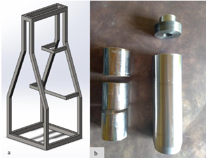
FIGURA 1. (a) Modelagem em software da concepção inicial da estrutura. (b) Estrutura responsável por acomodar os anéis, e ao lado de três anéis confeccionados.

Os anéis para amostra indeformada, foram elaborados a partir de tubo de aço inox 304, com diâmetro interno e externo de respectivamente 6,1 e 6,4 centímetros, e com 6,0 centímetros de comprimento, promovendo assim um volume de 175 cm 3 para ser preenchido com solo.