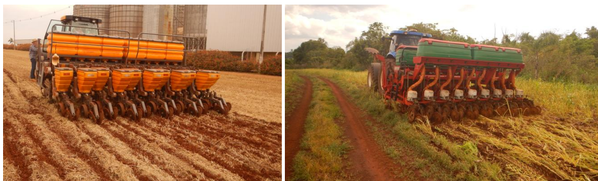
FIGURA 1 - Exemplos de máquinas avaliadas durante o estudo.

RESULTADOS E DISCUSSÃO: Foram avaliadas semeadoras em propriedades rurais da região Norte do Paraná e no Mato Grosso do Sul, totalizando 14 municípios com 35 modelos de 13 diferentes fabricantes nacionais, determinando-se parâmetros que possam identificar qualidade da semeadura (FIGURA 1).