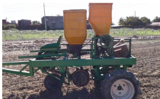
FIGURA 3. Protótipo da semeadora puncionadora utilizado para os ensaios em campo.

Observa-se na Figura 3 o protótipo da semeadora que foi construído para realizar a avaliação da distribuição de sementes de milho em campo e os resultados do teste realizado encontra-se na tabela 3.