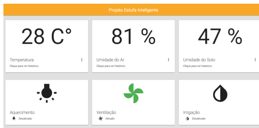
FIGURA 2. Dashboard do sistema.

O protótipo permite também que os dados coletados e as ações dos atuadores sejam registradas em tempo real, através de um website hospedado nos servidores da Google (FIREBASE HOSTING, 2020). Todo o sistema foi controlado pelo ESP8266 que é responsável por fazer a leitura dos sensores, interpretá-las e comandar os relés que fazem a interrupção dos atuadores, tal como (Figura 1b). Além disso, o ESP8266 também envia os dados a um banco de dados hospedado nos servidores da Google, os quais são armazenados para o usuário durante um período de 30 dias, para que ele possa gerenciá-los facilmente através de uma aplicação WEB , tal como ilustrado na (Figura 2) (FIREBASE REALTIME DATABASE, 2020).