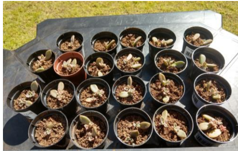
FIGURA 3. Mudanças de suculentas após 30 dias.

Durante o período experimental, a terra vegetal foi colocada em uma sementeira, e a partir da propagação de suculentas pelas suas folhas percebeu-se que o surgimento dos primeiros brotos foi aproximadamente nos primeiros 15 dias. Após 30 dias, as suculentas já estavam prontas para receber um novo lugar definitivo, tal como (Figura 3).