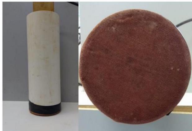
FIGURA 1. Tubo de PVC utilizado para calibração.

MATERIAL E MÉTODOS: O experimento foi realizado no Laboratório de Ecofisiologia do Instituto Agrônomo do Paraná (IAPAR), localizado na cidade de Londrina - PR. Foram utilizadas amostras de 30 kg de solo retiradas da camada de 0 a 20 cm de profundidade, provenientes da área onde se encontra a estação meteorológica do IAPAR Londrina. A amostra foi destorroada manualmente e seca ao ar, em seguida peneirada em malha de 2 mm. Posteriormente, foram colocadas em recipientes de PVC com 30 cm de altura e 10 cm de diâmetro, os quais foram vedados na extremidade inferior com uma tela plástica para permitir apenas a passagem de água e evitar a perda de solo (Figura 1).