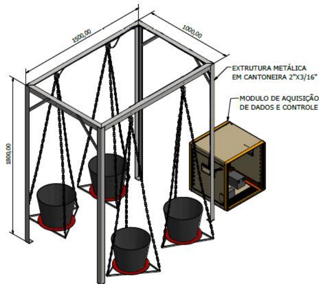
FIGURA 1. Estrutura metálica, disposição dos vasos e suporte para colocação do sistema de aquisição de dados..

Nesta estrutura metálica foram fixados os quatro conjuntos de pesagem. Cada conjunto é composto por um elemento sensor (célula de carga), que através de correntes de aço 3/16" é conectada a um prato metálico de aço de espessura 3 mm, construído no formato triangular para sustentação dos vasos contendo solo. Os vasos plásticos possuem volume de 21,5 litros, medindo 29 cm de altura, diâmetro superior de 37cm, e inferior de 27cm. Detalhes do conjunto de pesagem que compõe o minilímetro podem ser observados na figura abaixo(Figura 02).