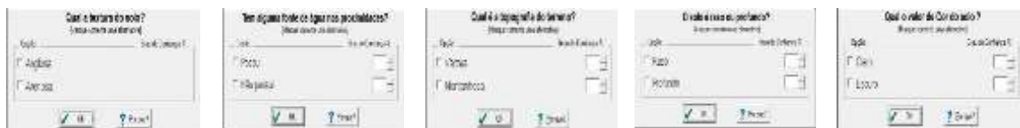
Figura 2. Interface sistema-usuário

RESULTADOS E DISCUSSÃO: A partir das variáveis definidas na fase de planejamento foram geradas 32 regras de produção (exploração agropecuária), que descrevem as distintas combinações de valores para cada variável, com o indicativo de possibilidade de utilização do solo. O emprego da base de regras foi a opção mais simples e compreensível para sinalização das possibilidades de uso do solo, além de se aproximar do modelo de raciocínio humano. Com relação a interface do sistema, o desenvolvimento se deu admitindo-se a premissa conversacional, em que são realizadas perguntas ao usuário, que após sua confirmação o SE irá solicitar a inserção de novas opções. Na Figura 2 observa-se as opções que o usuário precisa inserir através do sistema.